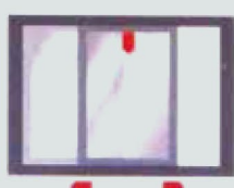
پنجره فولکس واگنی